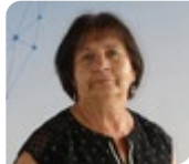
Michèle PETREAU Maire de Cherves